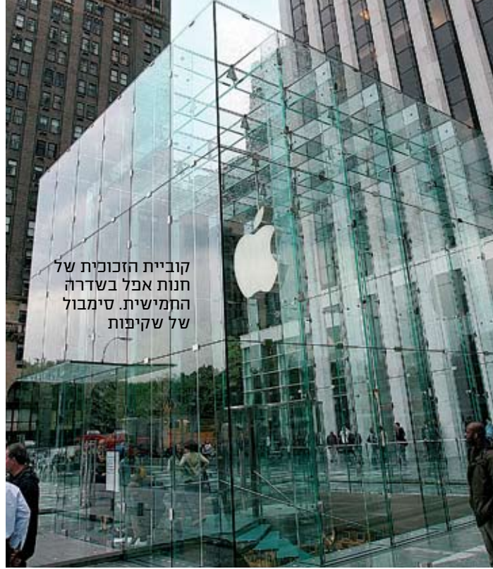
קוביית הזכוכית של חנות אפל בשדרה החמישית. סימבול של שקיפות