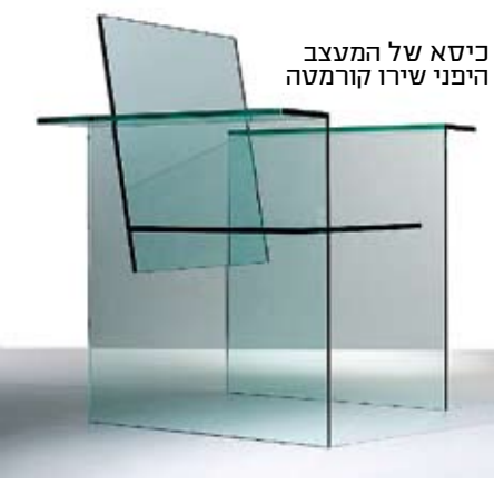
כיסא של המעצב היפני שירו קורמטה

בנטהאוז במנהטן, שכולו זכוכית. את כל הרהיטים בבית הוא תכנן מפרספקס - כיסאות ושולחנות בעלי מראה מאוד גיאומטרי. המעצב צ'רלס הוליס ג'ונס היה בשנות ה-60 הבן טון של הוליווד. פרנק סינטרה וג'וני קארסון היו מעריצים נלהבים של עיצוביו. גם הוא מתח את גבולות השימוש בפרספקס ועיצב מערכות שלמות מפרספקס שקוף. זה נחשב באותם ימים לעיצוב נוצץ ומרשים, בדיוק כמו גוף התאורה הבומבסטי שעיצב לטקס גלובוס הזהב לפני שנתיים.”