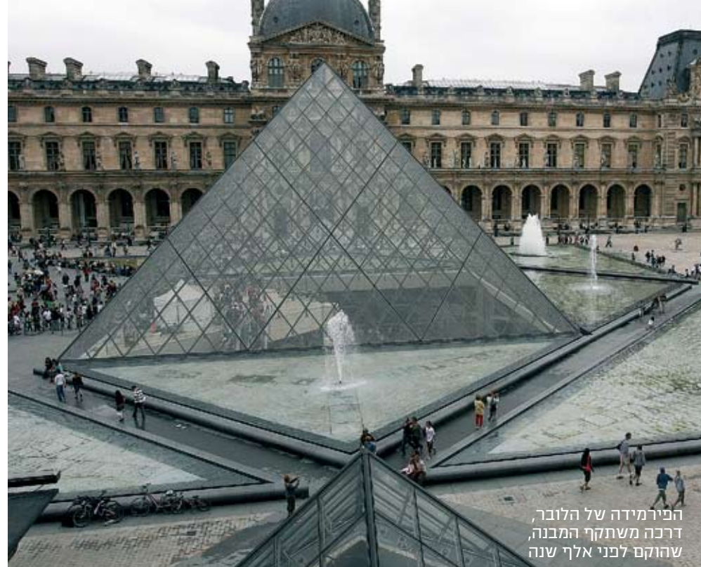
הפירמידה של הלובר, דרכה משתקף המבנה שהוקם לפני אלף שנה