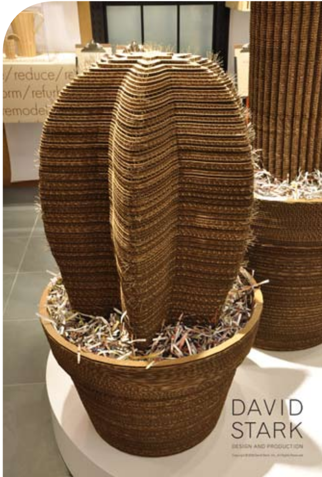
משמאל: צמח קקטוס עשוי קרטון גלי ממחזור במיצב עבור חנות הרהיטים אלם ווסט. ניו יורק, 2009 | מימין: כלי פורצלן בעיצוב דייוויד סטארק עבור חנות הרהיטים אלם ווסט. ניו יורק, 2010