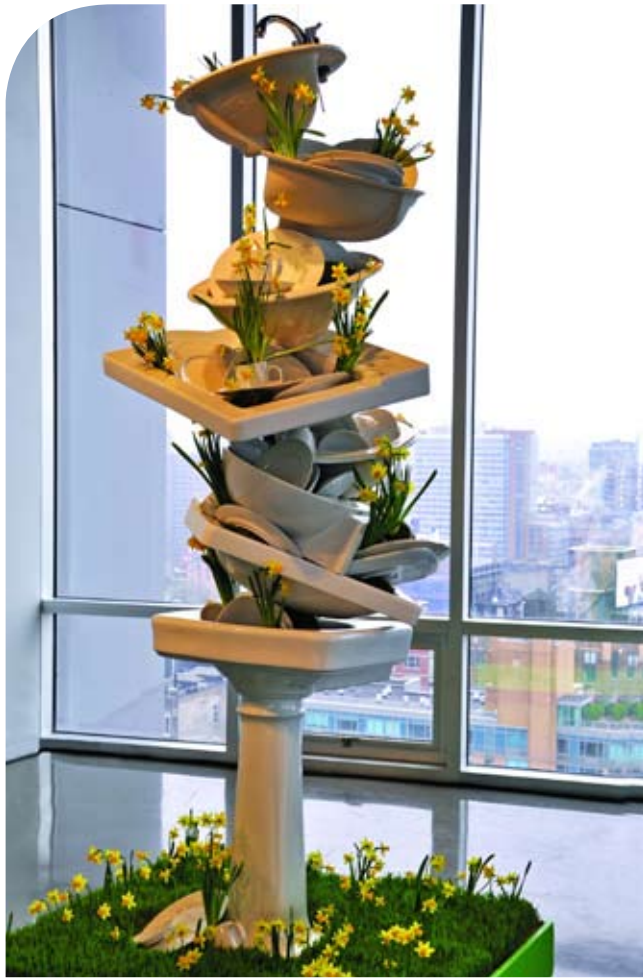
עמוד פיסולי עשוי חומרים ממוחזרים: שאריות כוורים וכלים עשויים פורצלן לבן. ניו יורק, 2009

מ אז שהקים חברה להפקה ולעיבוד אירועים לפני כעשור, הפך דייוויד סטארק לאחד ממעצבי האירועים המוערכים והעסוקים ביותר בארצות הברית. את האירועים המרהיבים והדרמטיים שלו, הנודעים בזכות הפנטזיה והיצירתיות שלהם, הוא יוצר בעבור לקוחותיו, שעליהם נמנים הזמרת ביונסה והקומיקאי ג'ון סטארט, חברות ענק העוסקות באסתטיקה כמו טארנט וקונדה נאסט, מוזיאונים וארגוני צדקה כגון קרן פיטרפן ואגודת ידידי מוזיאון ישראל. לאחרונה השיק סטארק סדרת כלי אוכל ואביזרי שולחן בעבור חנות הרהיטים ווסט אלס, והוציא לאור ספר חדש המתעד את האירועים המרהיבים שלו. סטארק הוא אורח קבוע בתכניות טלוויזיה ובמגזינים לעיצוב. ממש כמו באמנות מושגית, גם באירועים שלו הדגש מושם על האירוע כרעיון אסתטי. במרכז אירוע ההתרמה שעיצב לפני חודשיים בעבור אגודת ידידי מוזיאון ישראל עמד מוטיב המים, בהשראת המבנה החדש של המוזיאון.