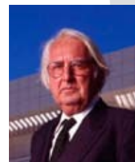
על ריצ'רד מאייר:

"ריצ'רד מאייר, שכה השתוקק לתפקיד מתכנן מרכז גטי, הבטיח כי יבנה משרד בלוס אנג'לס, שיפקח באופן אישי על כל תהליכי הבנייה וכן שלא ייקח על עצמו פרויקטים נוספים בתקופת הבנייה. אני מאמין שבסופו של דבר, הפרויקט פגם בקריירה שלו"