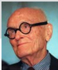
על פיליפ ג'ונסון:

"המבנה המפורסם ביותר של פיליפ ג'ונסון, בית הזכוכית, היה העתק מדויק של בית פארנס שאותו תכנן מיס ואן דר רוהה. מיס היה מזועזע ומרוגז ביותר, אך הוא גם לא יכול היה להרשות לעצמו לתת לרוגז שלו ביטוי"