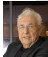
על פרנק גרי:

"את עבודתו של פרנק גרי אני מכיר היטב מאז שנות השבעים, אך מעולם לא חלמתי שדווקא הוא, יותר מכולם, יגיע כל כך רחוק; שדווקא הוא ישנה את פני ההיסטוריה של האדריכלות"